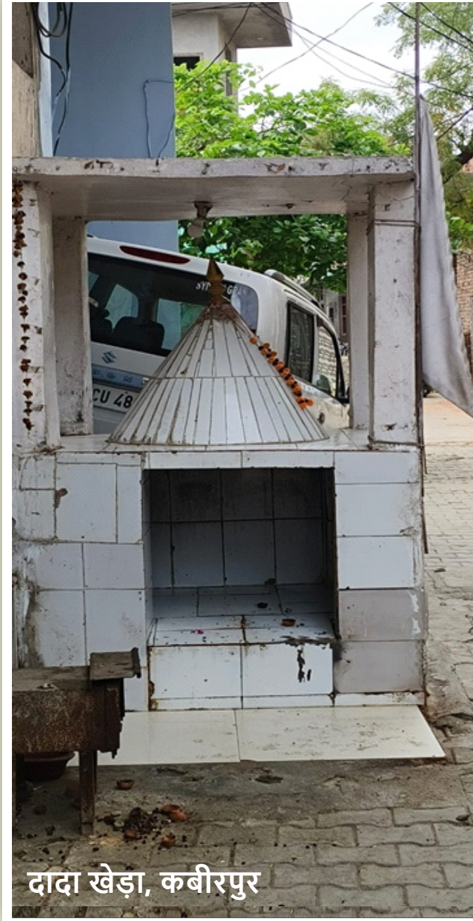
दादा खेड़ा, कबीरपुर

दादा खेड़ा के साथ तुलना करने पर यह फर्क और स्पष्ट होता है। वहां महिलाएं रोजाना पूजा में सक्रिय रहती हैं और स्थल को नहलाने जैसे काम करती हैं। दोनों जगहों पर आस्था है, लेकिन उसे निभाने के तरीके अलग हैं।