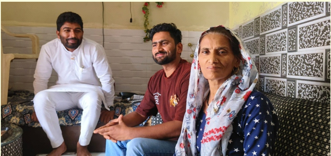
कबीरपुर का एक परिवार: अपने समय और मेहमाननवाज़ी को लेकर बेहद उदार

कबीरपुर अब पहले जैसा गांव नहीं दिखता, लेकिन इन मान्यताओं के जरिए उसकी पहचान और जुड़ाव अब भी बना हुआ है—कबीरपुर में भी और शादीपुर में भी, जहां लोग आज भी खुद को एक ही परंपरा का हिस्सा मानते हैं।